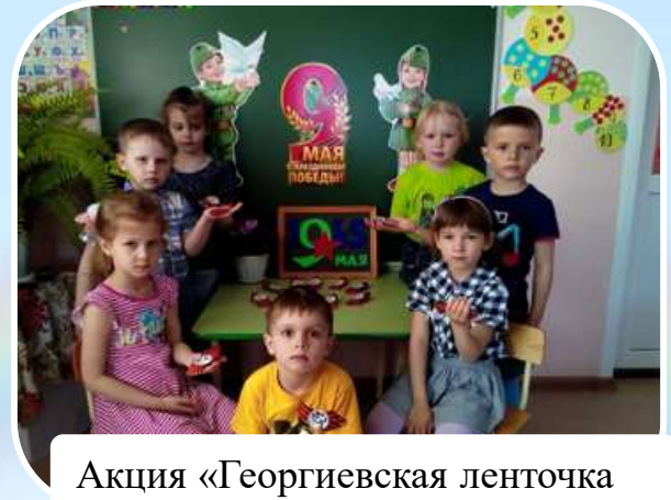
Акция «Георгиевская ленточка»