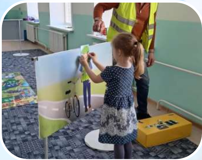
Детско-юношеский центр Мамонтовского района (реализация программы по профилактике ДТП «Светофорик»).

Сотрудничество детского сада со многими организациями райцентра помогает нашим воспитанникам получать всестороннее развитие. Вариативные формы работы дополняют и обогащают знания детей, получаемые при реализации основной образовательной программы дошкольного образования: