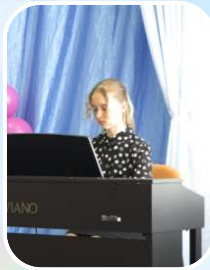
Мамонтовская детская школа искусств (реализация программы «Первые шаги в искусство»).