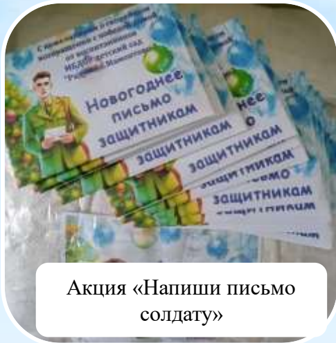
Акция «Напиши письмо солдату»

Благодаря их поддержке наши воспитанники активно участвуют в различных акциях, конкурсах, викторинах, соревнованиях на всероссийском, краевом и муниципальном уровнях, занимая призовые места.