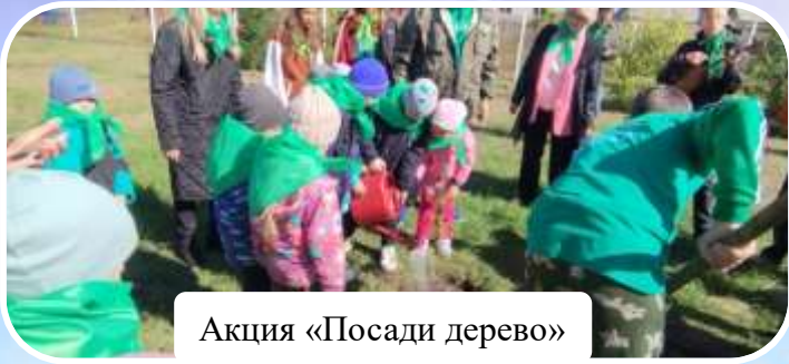
Акция «Посади дерево»

Благодаря их поддержке наши воспитанники активно участвуют в различных акциях, конкурсах, викторинах, соревнованиях на всероссийском, краевом и муниципальном уровнях, занимая призовые места.