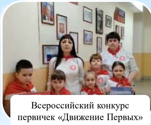
Всероссийский конкурс первичек «Движение Первых»