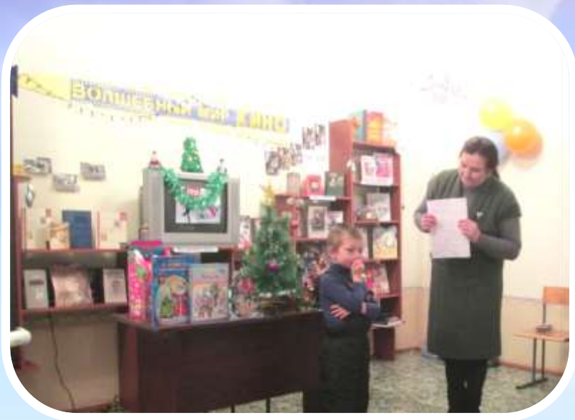
Модельная детская библиотека (реализация программ «Вместе с книжкой и игрушкой», «В любое время года, в любое время дня»).