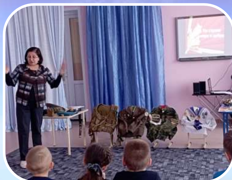
Мамонтовский районный краеведческий музей (реализация программы «Музейный абонемент для детей»).

Встречи и игровые упражнения с сотрудниками ГИБДД и Росгвардии укрепляют знания об основах безопасной жизнедеятельности.